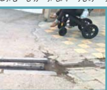
بسیاری از وسایل نقلیه عمومی با مشکلاتی مانند نبود تجهیزات ویژه، نبود جایگاه مناسب برای ویلچر، اطلاع‌رسانی ناکافی برای نابینایان و نشانیابان و همچنین نبود آموزش کافی برای