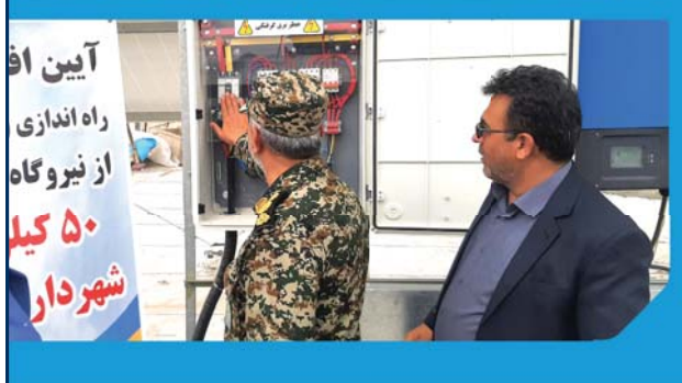
آیین اف راه اندازی از نیروگاه ۵۰ کیلو شهردار