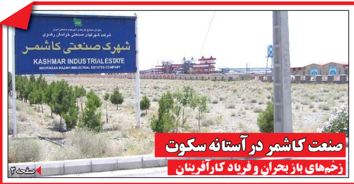
صنعت کاشمر در آستانه سکوت زم‌خهای باز بحران و فریاد کارآفرینان