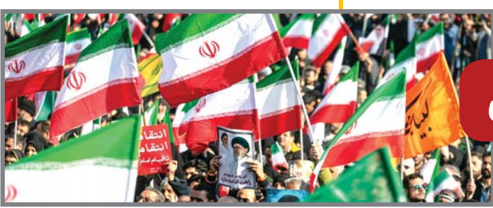
نفس برای روزهای آینده ما می‌گذاید»

اکنون سیاستمداران آمریکایی نگران وجهه بین‌المللی کشورشان، احتمال بروز شکاف میان آمریکا و اروپا، و همچنین هزینه‌های جنگ هستند که باقتصاد و معیشت مردم آمریکا تأثیر منفی گذاشته است. بنابراین، به نظر می‌رسد هرچه دامنه مدت جنگ افزایش یابد، شکاف‌های چندگانه‌ای در جامعه و میان نخبگان آمریکا تشدید گردد و این وضعیت ممکن است به نفع متحرکات‌ها در انتقالات آتی که پاییز سال برگزار خواهد شد، تمام شود و نتیجه به از دست دادن موقعیت فعلی حزب جمهوری خواه گردد.