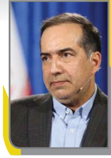
معاون توسعه مدیریت و منابع وزارت فرهنگ و ارشاد اسلامی گفت: سیستم مدیریتی شهوت مغرور نومیسی دارد.