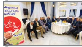
گریبان گیر همه اصناف است می‌شود از راه رفتن بر لبه تیغ سپهر سیاسی با وجود تلاطم‌های بی‌شمار آن به سلامت عبور نمایند و امید است که با جایک ساری و روزآمد نمودن از چالش رقبای تازه‌نفس، قوی و فراگیر عرصه مجازی نیز با توان مضاعف گذر نمایند.