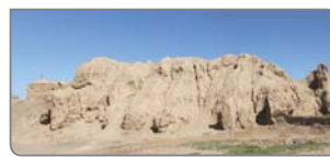
عمیدالملک کندری؛ وزیری فاضل و با درایت