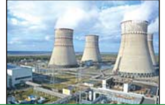
یک فعال محیط زیست هشدار داد: