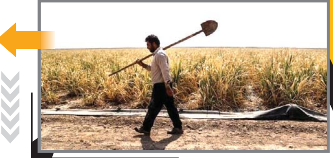
هر چند منطقه ترشیز به‌عنوان قطب تولید انگور، پسته و انار در استان خراسان رضوی مطرح است اما خاموشی چاه موتورهای کشاورزی و افزایش مدار آبیاری باغات، کشاورزان و فعالان بخش کشاورزی و بهره‌برداران این بخش را با مشکل جدی مواجه کرده است. باغات تنگه که مدار آبیاری آن‌ها طولانی شده، گرمای هوا را تاب نمی‌آورند و در برابر افت‌ها و بیماری‌ها گاه به‌کلی خشک شده و از یا در می‌آیند. این در حالی است که ۹۰ درصد مردم منطقه در پایه کشاورزی است و خشکی باغات و نبود محصول پربار است یا بروز مشکلات اقتصادی و آسیب‌های دیگر برای کشاورزان.

ناصری با بیان این که خاموشی چاه موتورها منگه‌هی است که نفس کشاورزان را گرفته و کشاورزی