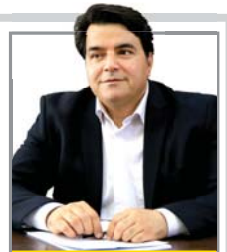
کوشای از آنچه «سلیمانی» به یادگار گذاشت