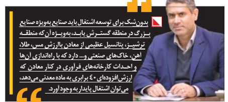
بیرون شک برای توسعه اشتغال باید صنایع به ویژه صنایع بزرگ در منطقه گسترش یابد، به ویژه آن که منطقه ترشیز، پتانسیل عظیمی از معادن یازار زرش، مس، طلا آهن، خاک های صنعتی و دارد که با راه اندازی آن ها واحدها کارخانه های فراوری در کنار معادن که ارزش افزوده ای ۴۰ برابری به ماده معدنی می دهد، می توان اشتغال پایدار به وجود آورد.