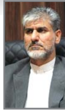
رئیس شورای استان خراسان رضوی

قصه رویکردی که آقایان در قبال این منطقه پیش‌گرفته و هم‌چنان دست از تغییرات بر نمی‌دارند، به سود مردم نیست و تجربه دو سه سال اخیر ثابت کرده بیشتر مدیران فعلی رفاقی، جریانی و سطرشی انتخاب شدند که شاید «ناکارآمدی» مالاک اولیه نبوده و از طرفی مردم توقع دارند این جسارت را آقایان داشته باشند و اگر در انتخابات‌شان اشتباه کردند، شکرگرد پله دوم را اجراء نکنند.