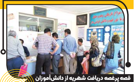
قصه پرغصه دریافت شهریه از دانش آموزان