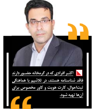
اکبر افرادی که در گرمخانه حضور دارند فاقد شناسنامه هستند، در تلاشیم با هماهنگی ثبت‌احوال، کارت هویت و کاور مخصوص برای آن‌ها تهیه شود.

گرمخانه جدید در مکان دیگری نمود. وی تصریح کرد: گرمخانه فعلی دارای کمترین امکانات و ظرفیت محدود ۵۰ نفر برای هر شب را دارد. شهرداری تلاش نموده با تهیه حداقل‌هایی زمینه ساماندهی این افراد را فراهم تا شاهد حضور آنان در زیر پل‌ها و مسیله‌ها نباشیم. شهردار کاشمر عنوان کرد: با توجه به اعتراض شهروندان و پیگیری اعضای شورای شهر برای جابجایی این گرمخانه اقدام شد که پس از بررسی، شهرداری ملکی در میدان ولی عصر به‌عنوان گرمخانه موقت و مورد تأیید قرار گرفت. کوهسرخ عدم هم‌جواری با خانه‌های مسکونی و محل اتصال خریم به محدوده را از مزایای این مکان جدید برشمرد و گفت: شرکت‌های خدماتی آب، برق و گاز برای نصب انشعابات لازم نیز اعلام آمادگی کرده‌اند و بازسازی این مکان در دستور کار شهرداری قرار گرفت. وی تأکید کرد: با نصب انشعاب آب شرب و گاز مکان جدید