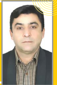
مدیریت شهری به دنبال یافتن روش‌هایی برای ارتقای رفاه شهروندان و حال خوب شهر است که در چشم‌انداز شهری و رفتن به سمت تأمین زیرساخت‌های موردنیاز شهری برنامه‌هایی ترسیم و در حال اجراست.

شهری برنامه‌هایی ترسیم و در حال اجراست. وی با اعلام این که سازمان حمل‌ونقل و اتوبوس‌رانی شهرداری کاشمر برای رفاه شهروندان برنامه‌های مختلفی را در دست انجام دارد؛ افزود: هم‌اکنون حمل‌ونقل درون‌شهری با فعالیت تاکسی‌ها در خیابان‌های اصلی به‌صورت گردش و ایستگاهی خدمات ارائه می‌دهند. تجار عنوان کرد: برای افزایش فعالیت و خدمات بهتر به شهروندان، سازمان حمل‌ونقل شهرداری کاشمر در برنامه خود سیستم هوشمندسازی (اینترنتی) تاکسی‌های درون‌شهری را قرار داده است. وی با بیان این که اتوبوس‌های شهری نیز بیشتر در حومه شهر فعالیت دارند، مطرح کرد: با توجه به این که دولت در بند د تبصره ۵ بودجه سال قبل و امسال اعتباراتی را در قالب انتشار و فروش اوراق مشارکت