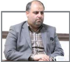
فرماندار کاشمر خیر داد؛

دانشمند طرح‌های اطلاعاتی آماده و مشخص باشد. دای‌صرف‌ها در ادامه به مشکلاتی که واحدهای تولیدی با بانکها دارند پرداخت و بیان کرد: دولت یک سری تسهیلات برای واحدهای صنعتی تکلیف نموده که پس از بررسی‌های لازم توسط کمیته تأمین مالی پرداخت می‌شود.