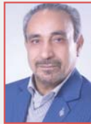
محمدرضا خیا فعال سیاسی اصلاح طلب

شرایط فعلی کشور به دلیل انتشار ویروس کرونا بسیار حساس و خطیر است و همه دستگاه‌ها نهایت تلاش خود را می‌کنند تا با کمترین خسارت از این شرایط بیرون بیاوریم. در این میان، برخی پیشنهادات نیز برای بهبود عملکردها ارائه گردیده از قبیل پیشنهاد چند روز گذشته برخی نمایندگان مجلس که با طرح سه فوریتی، تعطیلی یک‌ماهه کشور را خواستار شده‌اند.