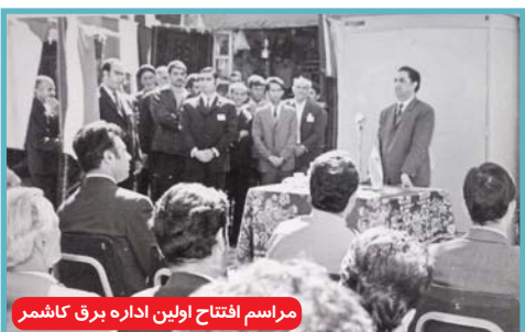
مراسم افتتاح اولین اداره برق کاشمر

امروز برای فعالیت نیروگاه‌های بزرگ، سوخت زیادی نیاز است و سرمایه ملی کشور برای تولید برق مصرف می‌شود. این کارمند بازنشسته شرکت برق که از سال ۱۳۹۱ بازنشسته شده، ادامه می‌دهد: از سال ۱۳۵۱ تا ۱۳۶۷ نیروگاه شش مگاواتی کاشمر دایر بود. روستاهای نزدیک به کاشمر مثل تربقان، فرگ و کسربنه و حاجی‌آباد از سال ۱۳۵۵ تا ۵۸ برق دار شدند و برق‌رسانی به سایر روستاها از سال ۶۲ شروع شد و در حال حاضر تمامی روستاهای ترشیز بزرگ برق دارند.