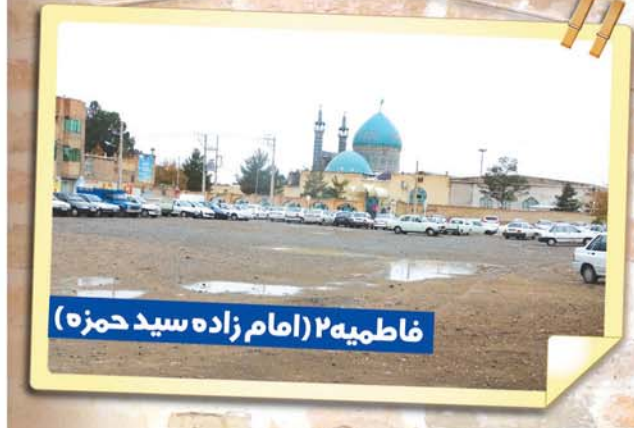
فاطمیه ۲ (امام زاده سید حمزه)