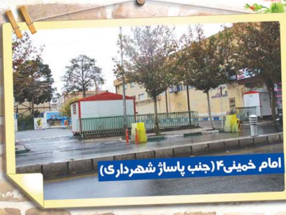
امام خمینی ۴ (جنب پاساژ شهرداری)