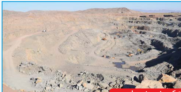
معدن مس نسیم شرکت کومه معدن پارس