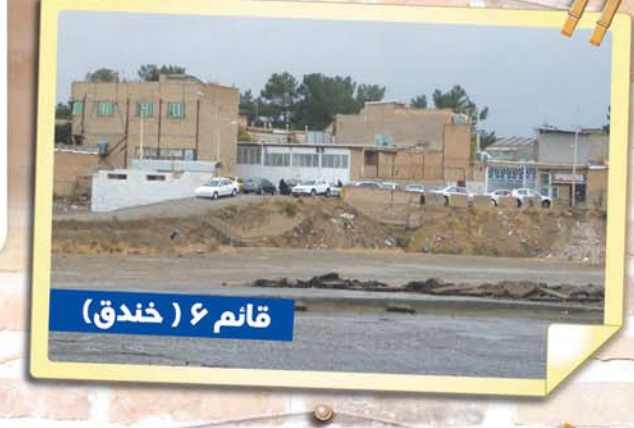
قائم ۶ ( خندق)