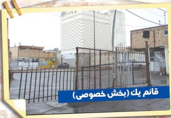
قائم یک (بخش خصوصی)