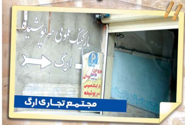
مجتمع تجاری ارگ