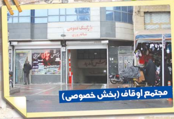
مجتمع اوقاف (بخش خصوصی)