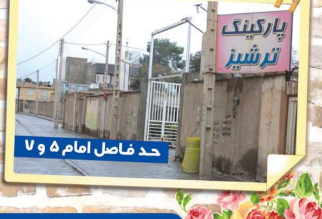
حد فاصل امام ۵ و ۷