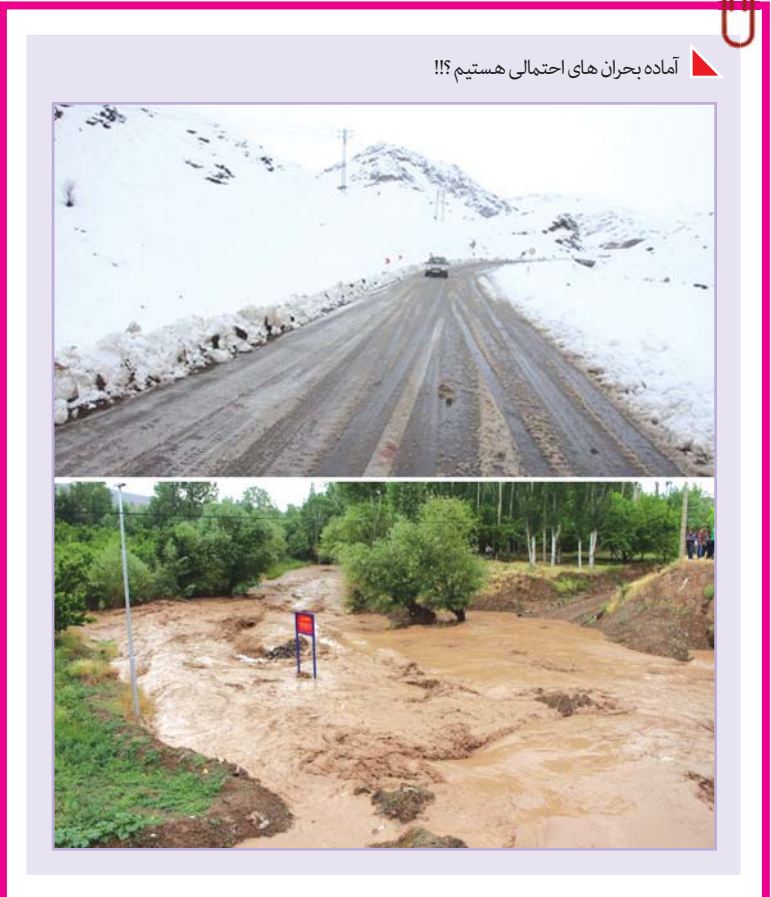
آماده بحران های احتمالی هستیم!؟

افزون بر این، باید تأکید کرد با این که بسیار سعی شده اینترنت در ایران تجاری شود و کسب و کار در اینترنت جایگزین فعالیت های فرهنگی و اجتماعی شود یا همپای آن قرار بگیرد، اما همچنان اولویت اول استفاده از اینترنت در ایران مربوط است به گردش آزاد اطلاعات، ارتباطات آزاد، رهایی بخشی و هویت بخشی افراد و همچنین سبک زندگی و سرگرمی که تمام این موارد به ارتباط اینترنت بین المللی وابسته است. حتی اگر از جنبه اقتصادی نیز بنگریم، با اینکه اینترنت داخلی توانسته کار بانک ها و کسب و کارهای اینترنتی را تا حدودی راه بیندازد، اما بسیاری از کسب و کارها همچنان به ارتباط بین المللی نیاز دارند و نمی توانیم بگوییم هم اکنون ما اینترنت اقتصادی را نجات داده ایم بلکه فقط اینترنت اجتماعی، فرهنگی و سیاسی را قطع کرده ایم. کشور ما با بحران های بسیاری، چه اقتصادی و اجتماعی و چه سیاسی و امنیتی، روبه رو بوده است که باید راه حل مواجهه با آن را تاکنون می آموزد. ساده ترین و ناپایدارترین راه حل در بحران ها قطع کردن ارتباطات است. اینترنت به یک زیرساخت اجتماعی و اقتصادی در ایران تبدیل شده که مثل آب و برق عمل می کند. اتفاقاً اینترنت در ایران فضایی «مجازی» و فانتزی نیست بلکه عین واقعیت است. همانطور که ما نباید در بحران ها، حتی در کوتاه مدت، بگذاریم آب و برق قطع شود،